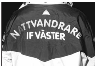
Baksidan på nattjackan.

– Vi ska absolut inte agera poliser utan försöka skapa kontakt med ungdomarna och ge oss tid att lyssna på dem. Genom andra nattvandrare vet vi att det har en lugnande effekt att vuxna finns ute på kvällarna. Vi tror att det